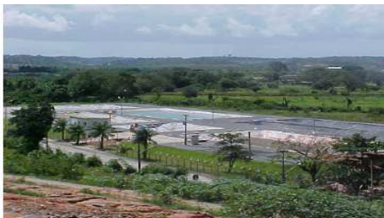
Figura 1 - Vista panorâmica da ETP-Muribeca

A ETP-Muribeca foi implantada em 2002, adotando um tratamento misto para o percolado do ACM, com base em dois subsistemas distintos: lagoas de estabilização (Figuras 1 e 2), e barreira reativa associada à fitorremediação.