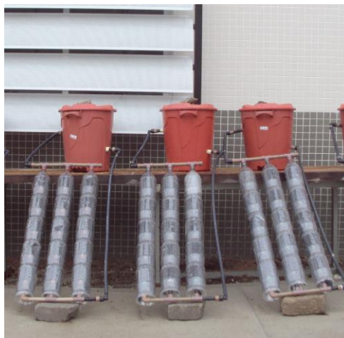
Figura 1: disposição dos reservatórios alternativos e CSBC. (Pelotas/2013).

Para o isolamento térmico foram aplicados polímeros sintéticos, materiais obtidos industrialmente, a partir de moléculas de baixo peso molecular. Entre os polímeros utilizados para o revestimento dos reservatórios de água quente, destacam-se: Poliuretano Expandido (EPS): material obtido do petróleo, não biodegradável, logo, se não for reciclado, constitui um problema ambiental;